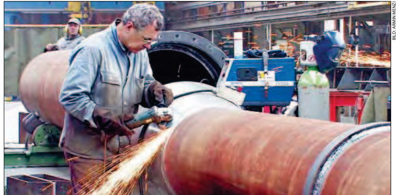
163 JAHRE JUNG. Die Frauenfelder Tuchschnid AG schafft aufsehenerregende Bauten aus Stahl und Glas.

Zum hohen Stellenwert von Frauenfeld als Wirtschaftsstandort tragen alteingesessene Betriebe ebenso bei wie der Zuzug von finanzkräftigen Firmen. Ein