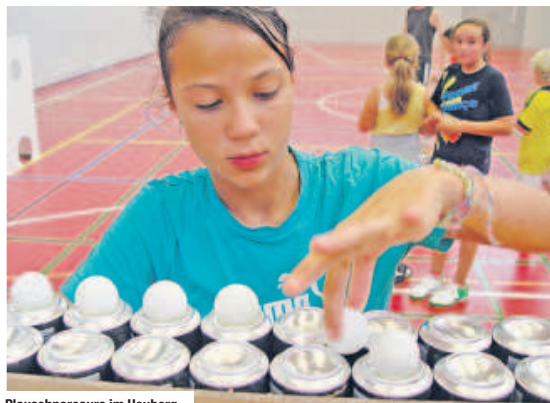
Plauschparcours im Heuberg