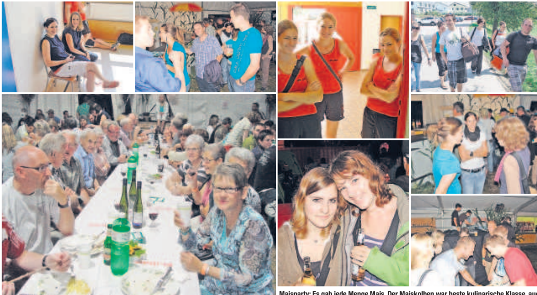
Jubiläums-Unterhaltungsabend am Samstag.

Das Festwochenende am 24.–26 August war von viel Abwechslung, Spiel und Spass geprägt: