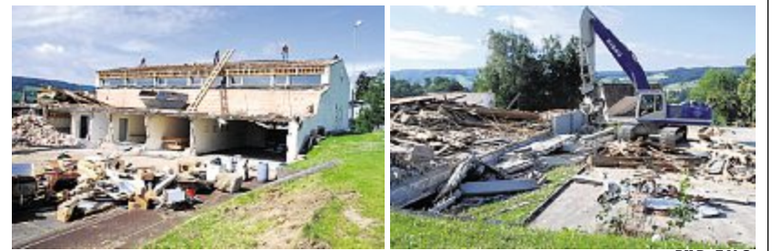
Die Turnhalle HOGA wird abgebrochen (links) und ist einige Wochen später verschwunden (rechts).

STEIN AM RHEIN Nach dem Spatenstich für die neue 3-fach Halle anfangs Juli wurde während den Sommerferien mit dem Abbruch begonnen. Mit dem Ende der Sommerferien sind die lärmverursachenden und den Schulbetrieb störenden Arbeiten nun weitgehend abgeschlossen, die Gebäude sind rückgebaut und die Stoffe zur Wiederaufbereitung in einer Grube abgeführt. Im Moment sind Bagger auf dem Baugelände und