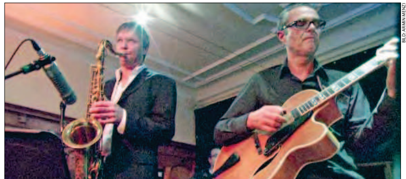
BESTE NOTEN. Jazz-Festival «generations» als Kulturhöhepunkt in Frauenfeld.