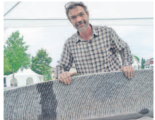
... Bildhauer, macht Reliefs aus Stein und Holz, wohnt in Lausanne und Martigny

Diesen Stein habe ich in Belgien geholt. Er ist ein belgischer «schwarzer Marmor», ist aber nicht Marmor, sondern Kalkstein. Er tönt sehr glasisch (klopft ...). Der Steinbruch liegt 66 Meter unter Boden. Den schönen Block habe ich mit nach Frauenfeld gebracht. Nun hat sich diese segelartige Form ergeben. Auf der einen Seite glatt, die andere ist stark strukturiert. Zu stehen kommt das Segel auf einen Sockel aus Granit. (s.S. 5)