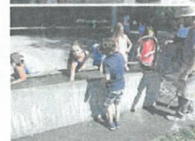
Work in Progress