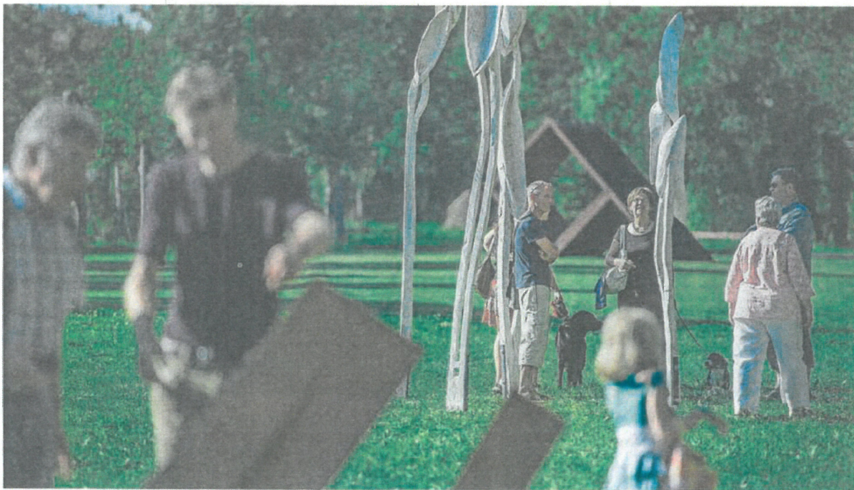
Vernissage-Gäste schauen sich im Murg-Auen-Park die fertigen Kunstwerke der Bildhauer-Woche an.