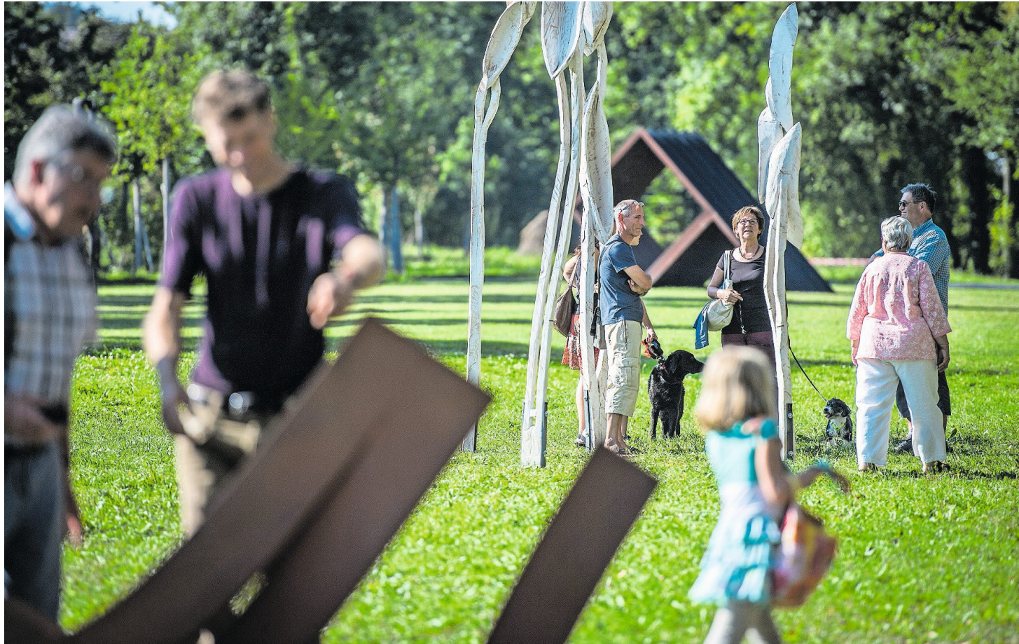
Besucher an der Vernissage der Bildhauerwoche 2016 im Murg-Auen-Park.