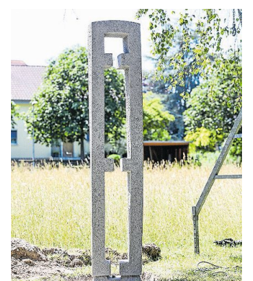
Basalt-Skulptur «Fanum»