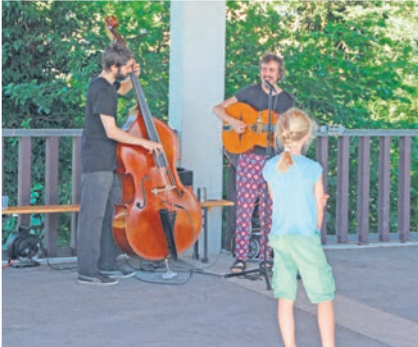
Musik von Valentin Baumgartner und Jonas Künzli.