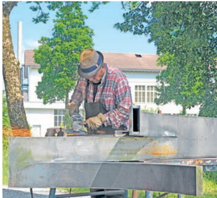
... und bei der Umsetzung des Kunstwerks.