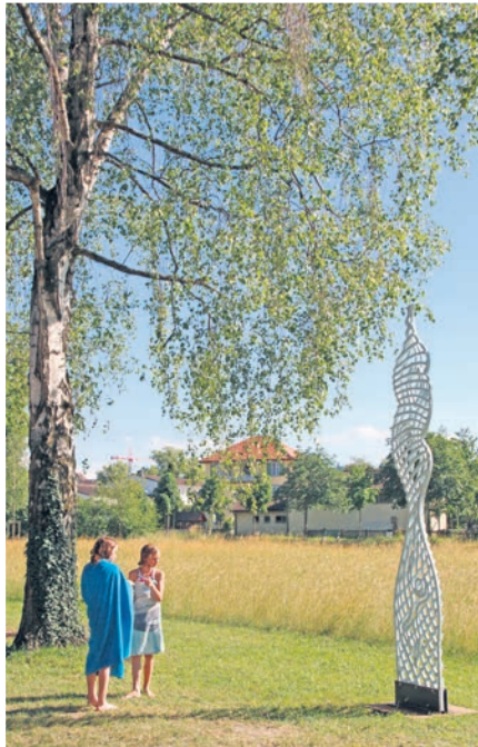
Kunstwerk aus Eschenholz von Adrian Bütikofer.