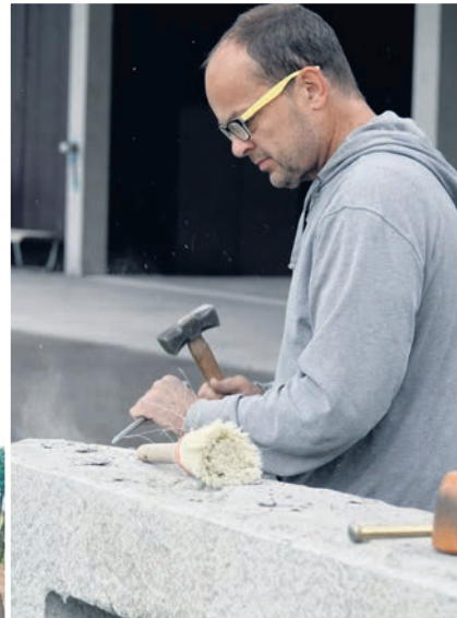
Der deutsche Bildhauer Christoph Schindler hat für seine Arbeit einen leichten Basaltstein mitgebracht – der Block wiegt «nur» 800 Kilo.