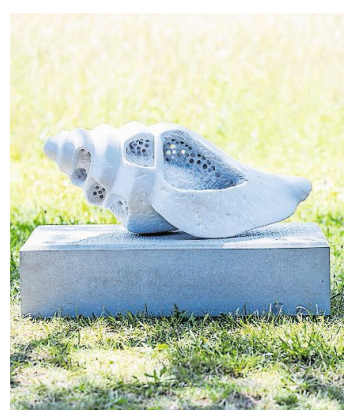
Marmor-Skulptur «Zahn der Zeit»