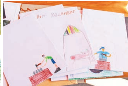
Die Kinder bedanken sich mit Zeichnungen.